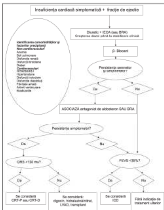
Figura 2. Algoritm de tratament pentru pacienții cu insuficiență cardiacă simptomatică și fracție de ejeție redusă.

Deși dificil de discutat, este important ca pacientul să înțeleagă factorii importanți de prognostic. Recunoașterea impactului tratamentului asupra prognosticului poate motiva pacienții să adere la recomandările terapeutice. O discuție deschisă cu familia poate ajuta în luarea deciziilor realiste și informatate cu privire la tratament și planuri viitoare.